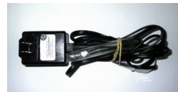
Lumière 20 watts halogène

Lumière 20 Watts halogène sur courant 12 volts 79,00$